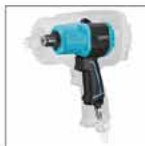
9013MTT w porównaniu do 9013TT