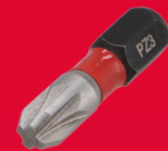
4932430869 BIT PZ3 25MM 4,29 ZŁ