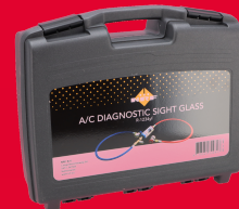
NRF38809 PRZYRZĄD DIAG. UKŁADU KLIM.R12 659,00 ZŁ