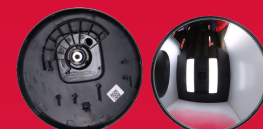
ZL01-50-030H-2 LUSTRO PRZEDNIE MB ATEGO AXOR PODGRZ. 60,00 ZŁ