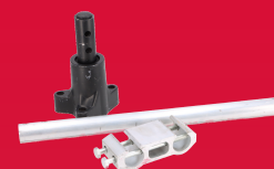
TD07-51-106 RURA MOCOWANIA BŁOTN.TYLNEGO VOLVO-FH 79,00 ZŁ