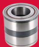
HDS212 ŁOŻYSKO PIASTY SCANIA 4 08.96- PRZOD 400,00 ZŁ