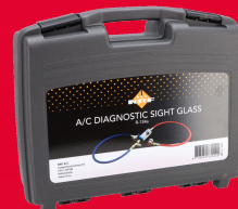
NRF38807 PRZYRZĄD DIAG. UKŁADU KLIM.R13 619,00 ZŁ