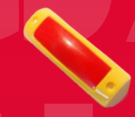
YG-19-026 WYŁĄCZNIK DRZWI CZERWONY W ŻÓLTEJ OBUDOWIE 5,50 ZŁ