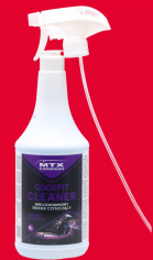
MTX-CLEANER PREPARAT COCKPIT CLEANER 1L 13,90 ZŁ