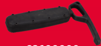
83600000 ZABEZPIECZENIE DRZWI NACZEPY 59,99 ZŁ