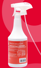
MTX-SOLUTION/1 AKTYWNA PIANA TRUCK SOLUTION 1KG 16,90 ZŁ