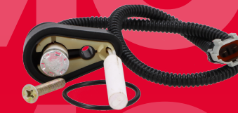
K2472 GRZAŁKA OSUSZACZA Z PRZEWODEM TYP KNORR 14,90 ZŁ