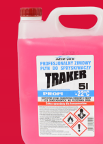
301L PŁYN DO SPRYSKIWACZY -22 5L RÓŻOWY ZIMOWY 7,70 ZŁ