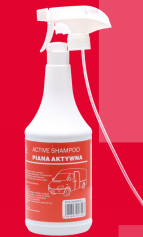
MTX-SHAMPOO/1 AKTYWNA PIANA ACTIVE SHAMPOO 1KG 15,90 ZŁ