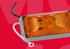
TD07-68-007 LAMPA OBRYŚ. DIOD.ZÓŁTA 3 DIODY 65*30*20 12,00 ZŁ