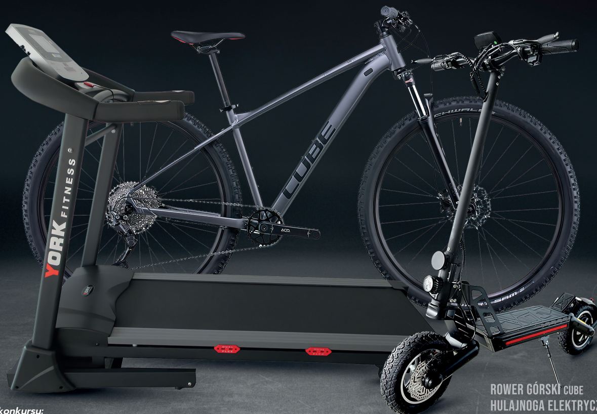
ROWER GÓRSKI CUBE HULAJNOGA ELEKTRYCZNA KUGOO BIEŻNIA TRENINGOWA YORK FITNESS

ZA OKRES OD 02.01.2022 - 31.05.2022 OTRZYMAJĄ NAGRODY W POSTACI ROWERU GÓRSKIEGO, HULAJNOGI ELEKTRYCZNEJ I BIEŻNI TRENINGOWEJ