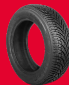
225/45 R17 HP3