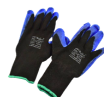
RDRAG11 RĘKAWICE ROBOCZE OCIEPLANE GUMOWE 11" 2,50 PLN