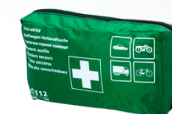
TOPD APTECZKA EURO-DIN 13164 33,00 PLN