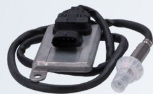
2011650 CZUJNIK NOX DAF LF,CF,SOLARIS 1 850,00 PLN