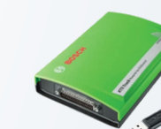
0684400512 URZĄDZENIE DIAGNOSTYCZNE KTS TRUCK DO SAMOCH.CIĘŻAR. 10 270,00 PLN