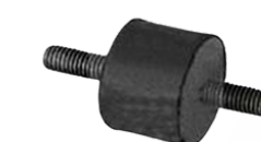
SEM10998 PODUSZKA TŁUMIKA RVI MAGNUM,MIDLINER 6,00 PLN