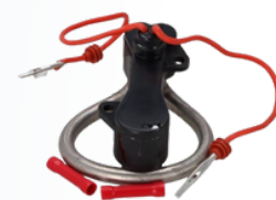
YY370/2 GRZAŁKA SEPERATORA VOLVO FH 17,20 PLN