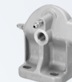
1677527/Z PODSTAWA FILTRA PALIWA VOLVO FH12 19,90 PLN