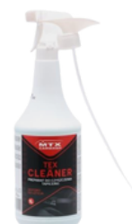
MTX-TEX PREPARAT TEX CLEANER 1L 15,80 PLN