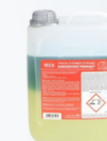
MTX-D-STRONG/5 AKTYWNA PIANA TRUCK D-POWER STRONG 5KG 60,00 PLN