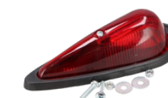
0064L/CZERW LAMPA OBRYS.ŁEZKA CZERWONA DUŻA 3,70 PLN