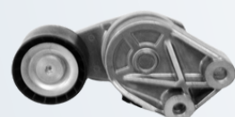
A-128 NAPINACZ PASKA VOLVO FH12/16 60,00 PLN