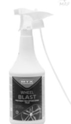
MTX-WHEEL PREPARAT WHEEL BLAST 1L 13,50 PLN