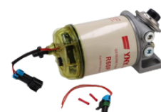
YY370 SEPARATOR KPL.Z GRZAŁKA VOLVO FH 149,00 PLN